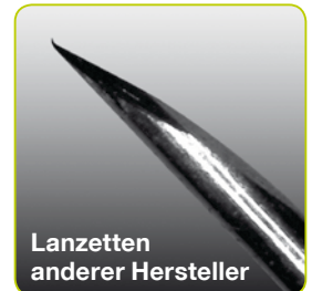
Lanzetten anderer Hersteller